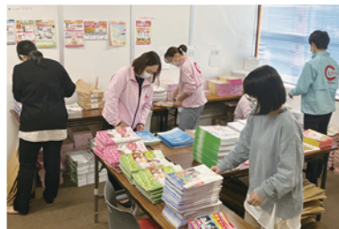
●みんなで力を合わせて袋詰め！

毎年制作をしている徳島大学生向け賃貸情報誌「大学BOOK」が今年も納品になりました。 この大学BOOKは、入社2年目若手社員が中心になり、企画から取材、構成を行っています。 受験生やその親御様に手に取っていただき、これからの徳島での新生活がわくわくドキドキするような一冊に仕上がったと自負しております！ さっそく、来春大学入学予定の方へ向けて、県内・県外の高校や高専へ発送いたしました。 ご協力いただきました、オーナー様、学生の皆様、地域の飲食店の皆様、誠にありがとうございました。 今年も、たくさんの方の新生の新生活のスタートに向けて、社員一丸となってサポートしてまいります。