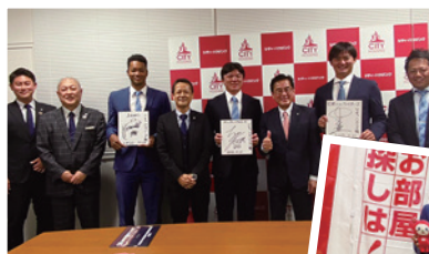
●今年指名された選手の皆さん。応援しています！