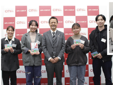
●慣れない日本に来て、不安と期待がいっぱいだと思います。はやく徳島に慣れればいいですね。