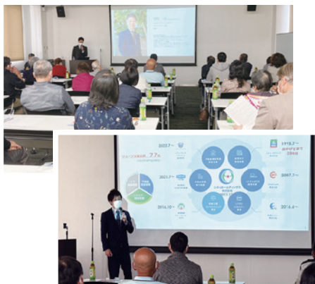
●大勢のオーナー様にお集まりいただきました。