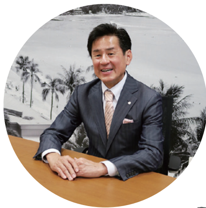
シティホールディングス株式会社 代表取締役社長 CEO シティ・ハウジング株式会社 取締役会長