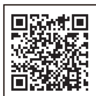
●コチラから視聴・登録していただけます。