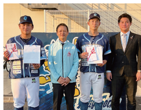
●オーダーズのお仕立て券のプレゼント。おめでとうございます。