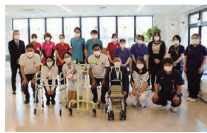
●シルバーカー寄付での支援活動。

本日、医療機関への支援活動として、いつも弊社従業員がお世話になっております『医療法人住友内科病院さま』へ、リハビリ器具3台を寄付いたしました。 歩行の補助を行う、「トレウオークスリム」「セーフティーアームウォーカー」の2台と自立して歩ける方が移動する際に荷物も運べるシルバーカー、「ボシエットSⅡ」を1台です。 この器具で皆様の健康づくりや機能回復に少しでもお役に立てれば幸いです。 地域の皆様へ医療を提供している住友病院の皆様とこれからも共に歩んでいきたいと思っております。