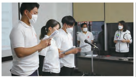
●最後は恒例の「頑張ろう三唱」で締めました。