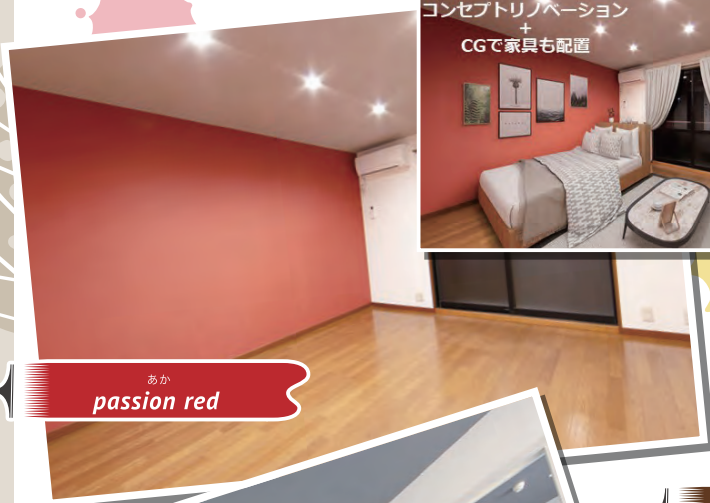
あか passion red