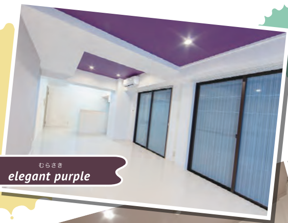
むらさき elegant purple