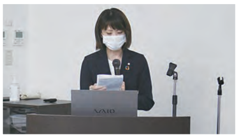
●22日はひとりひとりが発表していきました。