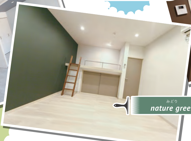
みどり nature green