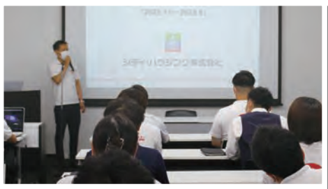
●いよいよ第29期経営計画発表会のはじまりです。緊張感がいっぱいです。