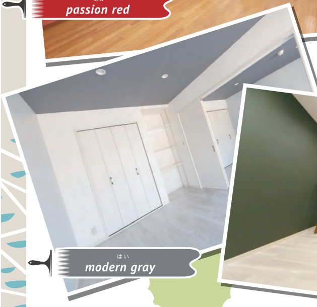
はい modern gray