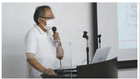
●各部署長による目標発表。