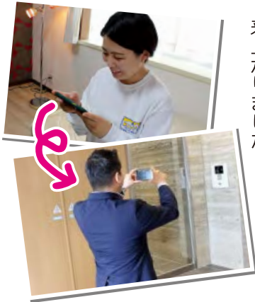
●お家にいながら、リアルタイムに映像を観られるので、好評です。

Zoom等システムを使用してのオンライン接客は昨年より増加、20組前後のお客様を対応させていただきました。 また、現地でのオンライン内見（スマートフォンを使用したライブ中継）はオンライン接客よりも増加傾向にありました。 社員も操作方法やカメラワークに慣れたことにより、来店が難しいお客様には積極的にオンライン内見をお声がけすることができているようです。 HPでも非来店でのお部屋探しを前面に出し、集客に繋がっています。 お客様からは「写真だけをHPや資料で見て部屋を決めるより、中継で社員さんと話しながらお部屋を決めることができるので、とても分かりやすい」と好評です。 ただ、対応したスタッフからは「部屋の広さなどお客様に伝わりにくい部分がある」という声があり、出来るかぎりお客様には周辺状況や車通り、お部屋の詳細まで丁寧に説明するように心がけているとのこと。 実際に内見をした後に改めて後日オンライン内見をしたり、オンライン内見をした方がお部屋の申込手続きに来店されるというお客様もあり、オンラインとリアルが融合したような形が出来上がりました。