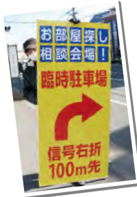
●今年もありがとうございました！

昨年同様、人員を配置する場所が増えたため、多くの徳島大学、四国大学の留学生アルバイト・協力業者様の力を貸りました。 寒い中、道路に立つて看板を持っていた学生アルバイトさん、お客様の送り迎えで、店舗と徳島駅やホテルの間を何往復もしていただいた協力業者様には、感謝しかありません。 そんな協力体制があり、今年の繁忙期も無事乗り越えることができました。