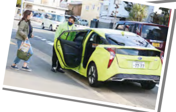
●密を避けることを徹底しました。

昨年引き続き、待合ブース、送迎ブースの場所を分散することで店内での密を避けることに成功しました。ご来店のお客様、お帰りのお客様をホテルや駅の間を送迎しております。お客様からは「送迎してくれるのは大変助かった！」とおっしゃっていただきお喜びいただきました。