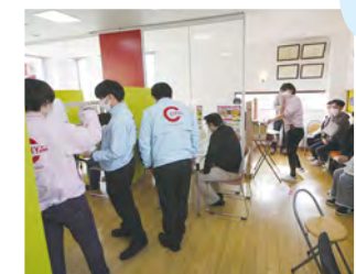
●普段とは全く違う店舗・事務所内レイアウト。