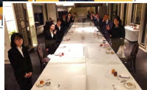
●これからの活躍が楽しみです。