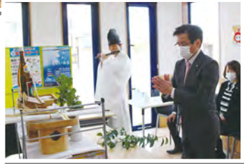
●朝の社内におごそかな空気が張り詰めました。