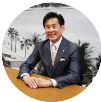
シティホールディングス株式会社 代表取締役社長 CEO シティ・ハウジング株式会社 取締役会長