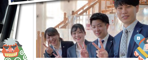
●撮影はいつも緊張します。でも良いCMになるように頑張りました。