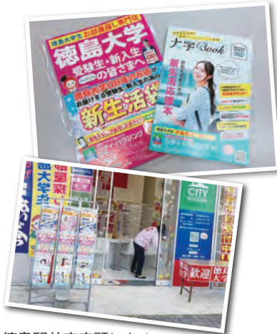
●徳島駅前店店頭にも!

11月1日、毎年制作をしている大学生向け貸賃情報誌「大学BOOK」が納品になりました。 この大学BOOKは、入社2年目若手社員が中心になり、企画から取材、構成を行っています。 受験生が手に取って、これからの徳島での新生活がわくわくどきどきするような一冊に仕上がりました。 さっそく、来春大学入学予定の方へ向けて、県内・県外の高校や高専へ発送いたしました。 また、徳島大学へ進学が多い四国内の高校・高専へは足を運び直接担当の先生へ手渡しをしています。 新入生のお部屋探しの準備が今年もはじまりまし