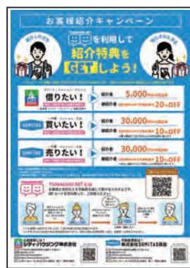
●新たな紹介ネットワーク。

シティ・ハウジングでは、「TUNAGARU(つながるネット)」という新たな紹介ネットワークを構築いたしました。従来は、「紹介カード」という紙のカードに、紹介者様の名前を記入いただき、来店されるご友人へお渡しをいただいていた。それを、まずは紹介者様自身に、このTUNAGARUネットへ登録をしていただき、そこで発行されるURLをご友人へLINE等を通して送りいただき、そこからお部屋探しの問い合わせをしていただくような仕組みです。 紹介者様を特定することが可能になり、また紙のカードを使用しなくともWEB上での問い合わせの時点で紹介のお客様であることがわかります。 今後、このネットワークを広げ、紹介者様からのお部屋探しを増やしてまいります。