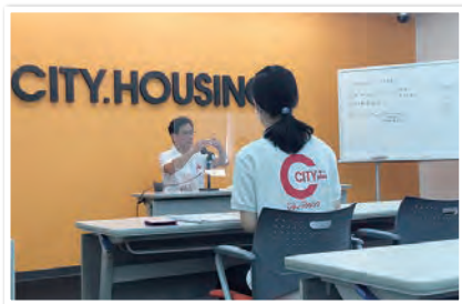
●最終日のディスカッション風景。