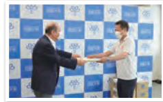
●贈呈式の模様です。