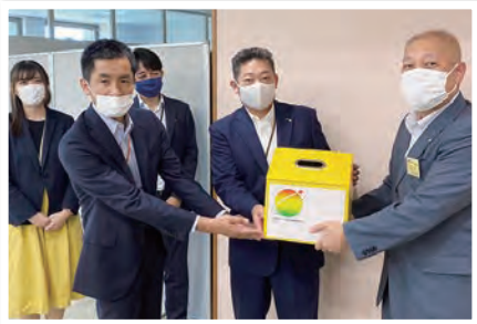
●皆様からの募金を四国放送様へ無事お渡ししました。

8月21日・22日、今年で4年目の24時間テレビの募金会場となるシティプラス徳島沖浜店には、二日間であくさんの方にご来場いただきました。たくさんの方に協力、応援をいただき、ありがとうございました。 9月6日に、四国放送様へ持ち込みを致しました。今後継続していきたいと考えております。