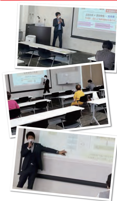
●次回11期セミナーも開催いたします。

徳島相続サポートセンターCITY開催の5月18日からスタートした第10期相続対策セミナー、全6回のセミナーの開催が終了しました。今回は多数のお問合せをいただきましたが、受講者は定員の7名とさせていたいただきました。次回11期の開催について参加者の受付を開始いたします。こちらも完全予約制の7名の定員でございます。詳しくは裏表紙をご覧ください。ぜひお問い合わせください。