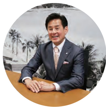
シティホールディングス株式会社 代表取締役社長 CEO シティ・ハウジング株式会社 取締役会長