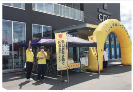
●今年もシティプラス徳島沖浜店が会場となりました。