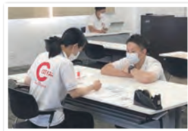
●先輩からのアドバイスに熱心に耳を傾けるインターンのみなさん。